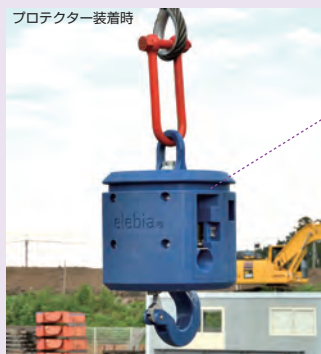
プロテクター装着時