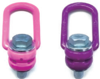
VLBG (従来品) VLBG-PLUS