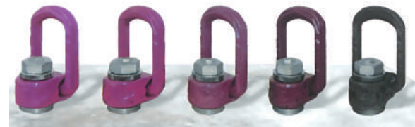
200℃ 225℃ 250℃ 275℃ 300℃

高温下で使用されても温度影響が目でわかる、 ルッド社独自のカラーコーション。(特許取得済)